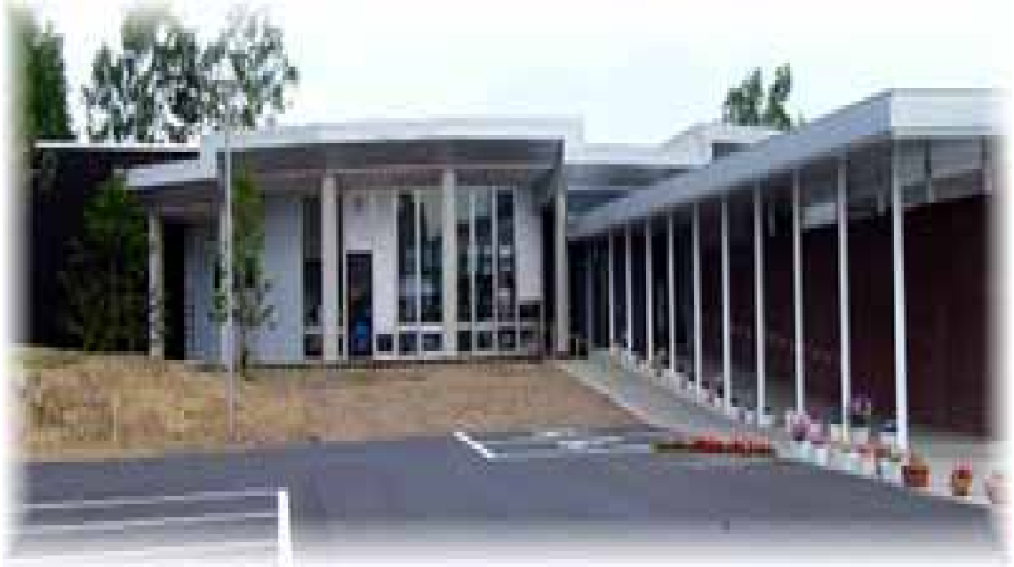
図 7 絵本の館外観