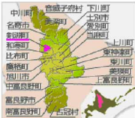
図 1 剣淵町の位置