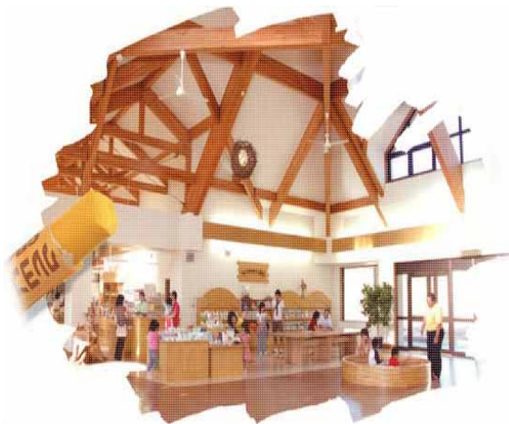
図 9 道の駅の中の様子