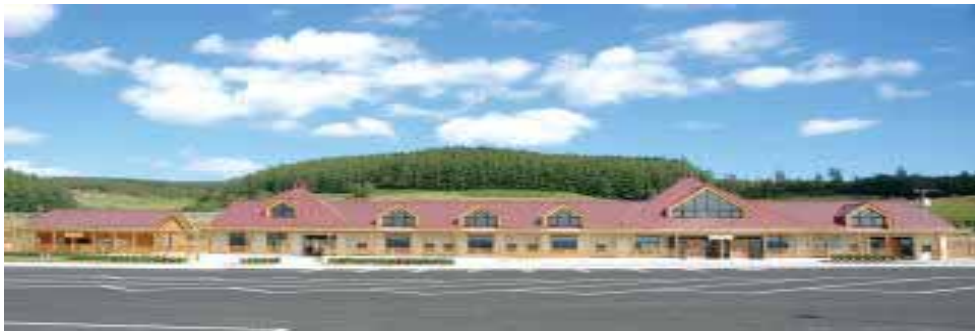
図 8 道の駅外観