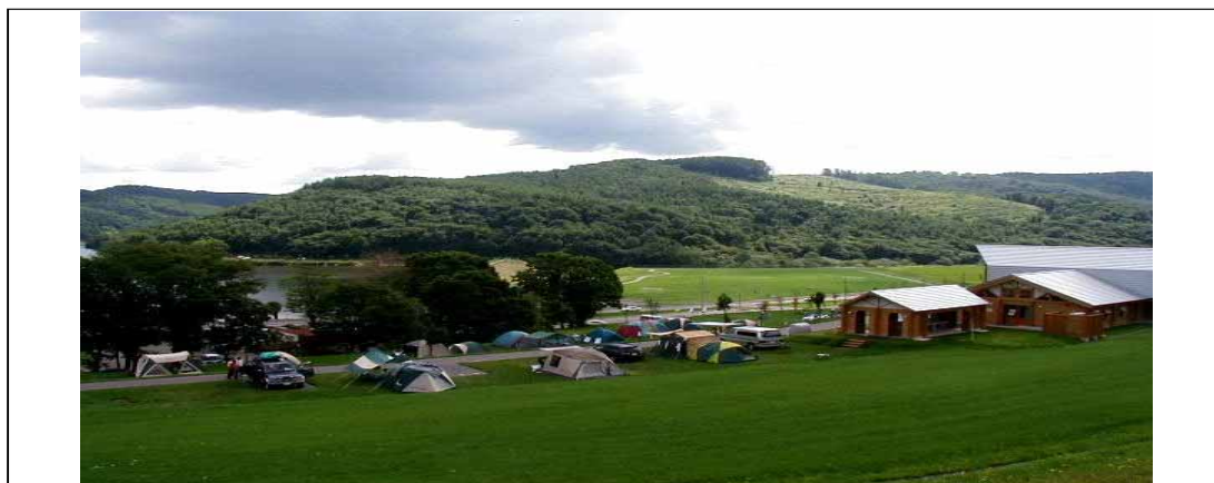
図 10 絵本の里家族旅行村キャンプ場