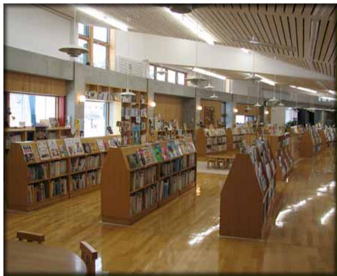
図6 絵本の館内の様子

図6、図7の現在の絵本の館は、さらに多くの人に安全で使いやすく親しまれるように、平成 16 年に新築移転したものである。